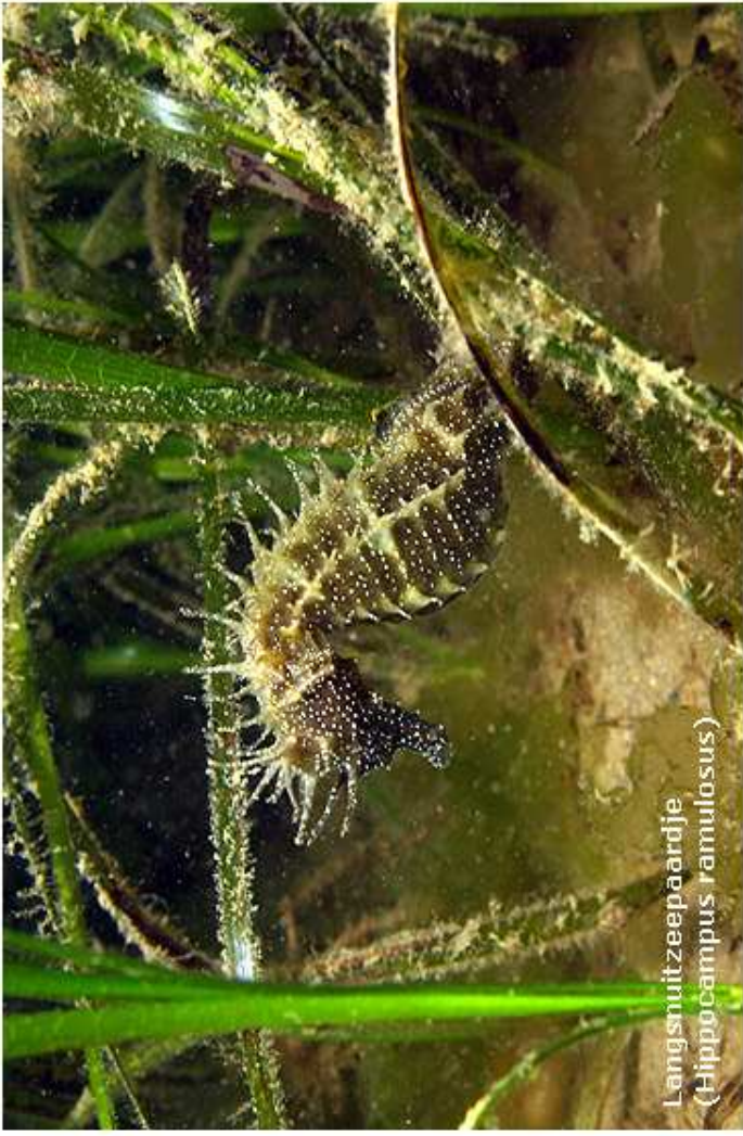
Langsnuitzeepaardje ( Hippocampus ramulosus )