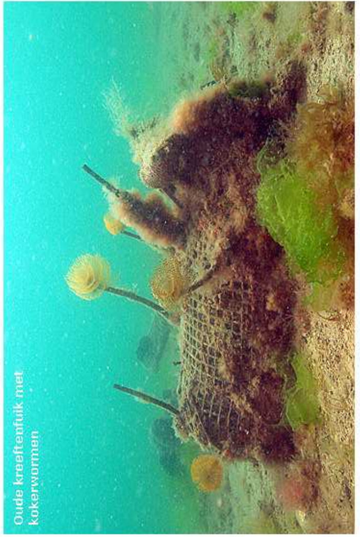
Oude kreeftenfuijk met kokervormen