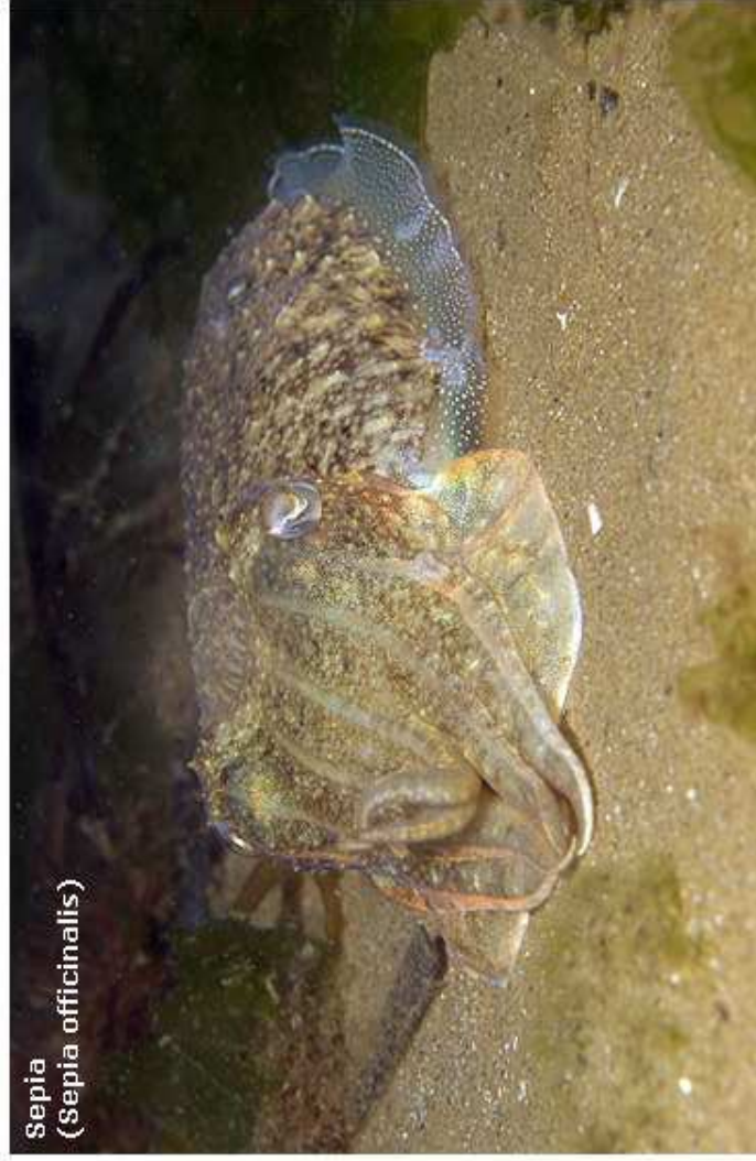
Sepia ( Sepia officinalis )