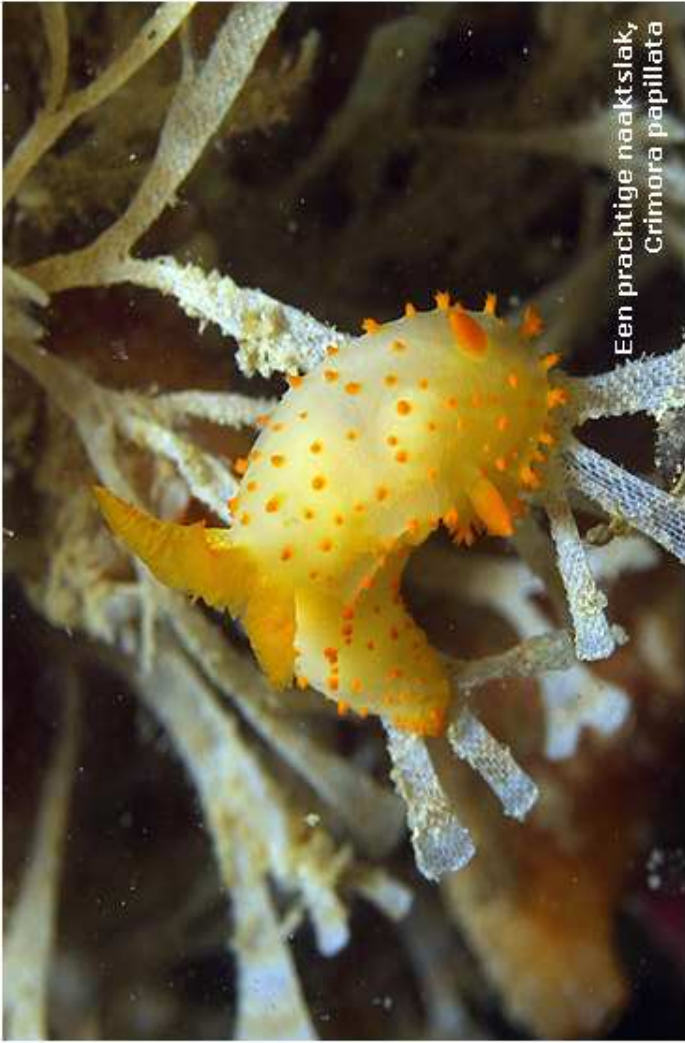
Een prachtige naaktslak, Crimora papillata