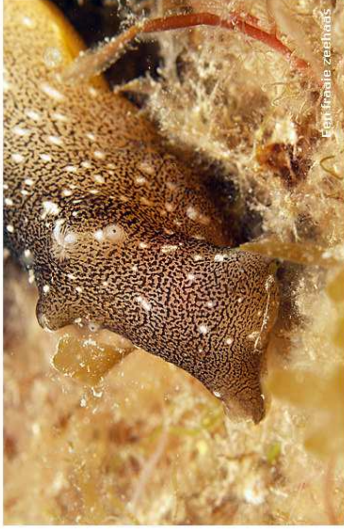
Een fraaie zeehaas