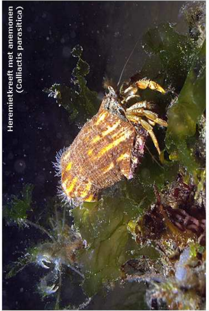
Heremietkreeft met anemonen ( Callinectes parasitica )