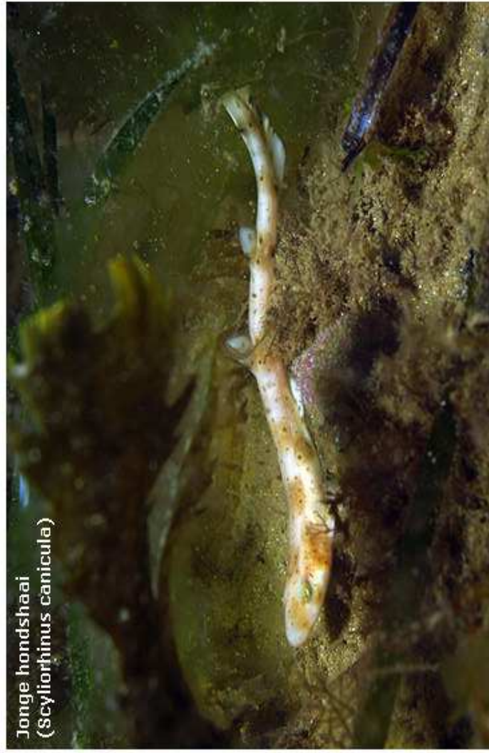
Jonge hondshaai ( Scyllorhinus canicula )