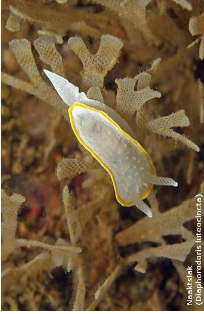
Naaktslak ( Diaphorodoris luteocincta )