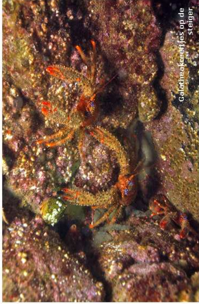
Galathea-kreeftjes op de steiger