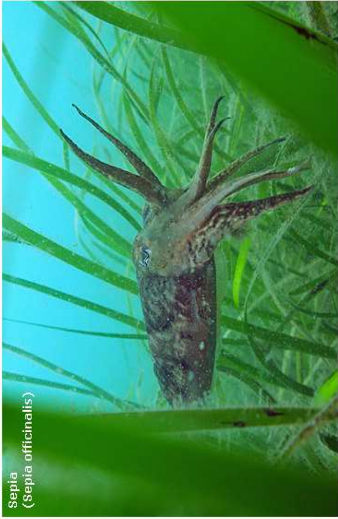
Sepia ( Sepia officinalis )