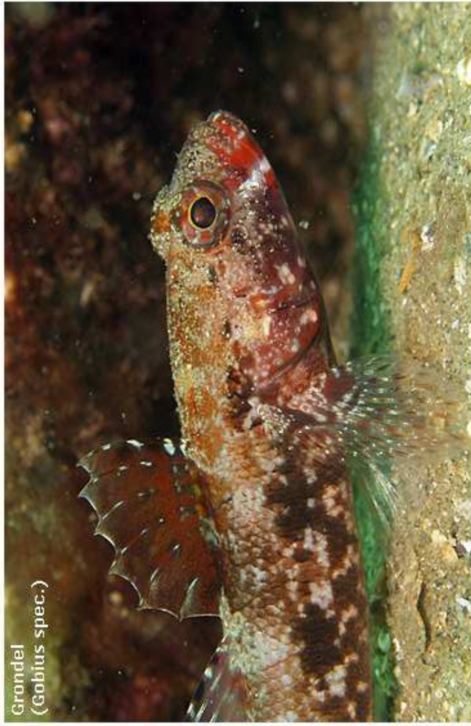
Grondel ( Gobius spec. )