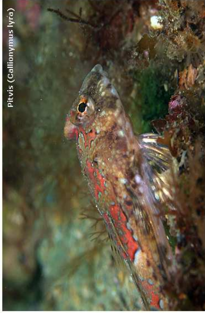
Pitvis ( Gallionymus lyra )