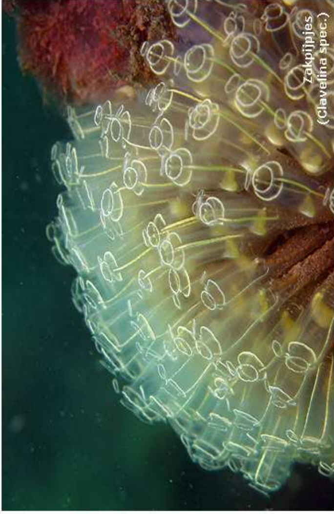
Zakpijpjes ( Clavelina spec. )