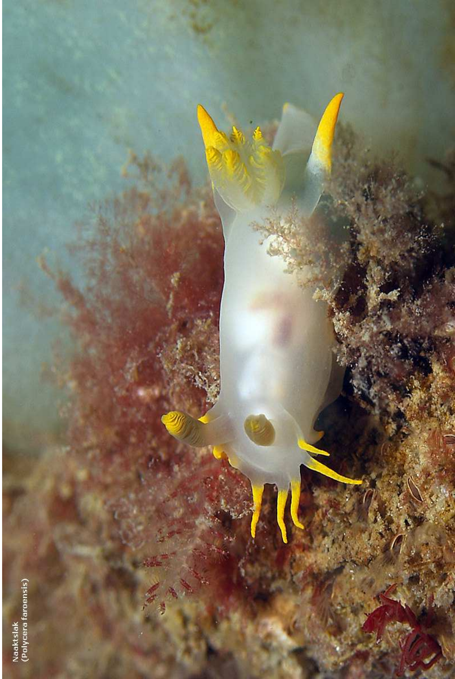
Naaktslak ( Polycera faroensis )