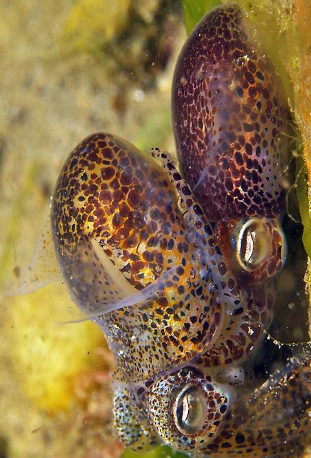
Two sepiola's ( sepiola atlantica )