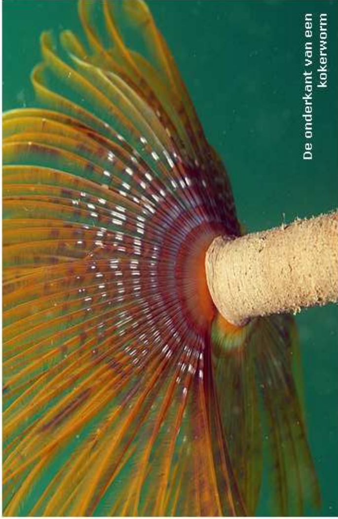
De onderkant van een kokerworm